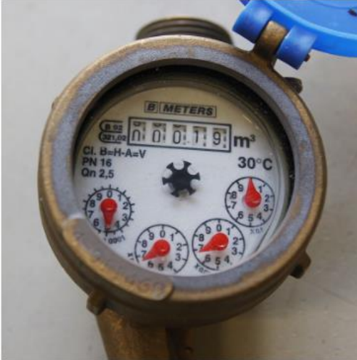
Mittarin lukema on 00019.

Lukema ilmoitetaan kokonaisina kuutioina, myös nollat. Pilkun jälkeisiä tai punaisia numeroita ei ilmoiteta.