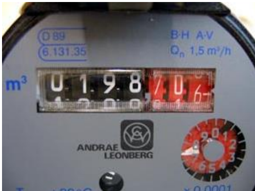
Mittarin lukema on 0198. Punaisella olevia lukemia ei lueta.

Lisätietoja saat vesihuollon asiakaspalvelusta puh. 0200 60200.