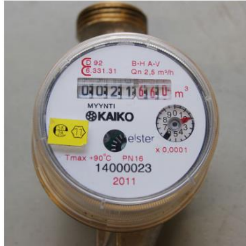
Mittarin lukema on 0021. Punaisella olevia lukemia ei lueta.